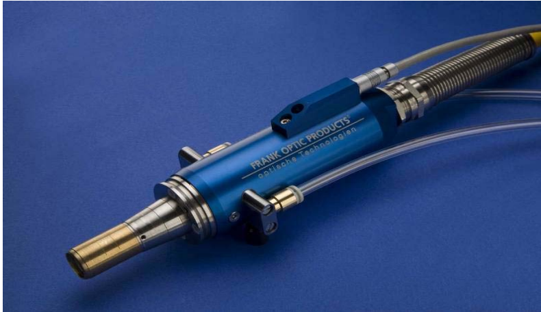
Hochleistungslaserkabel HPLD automotive