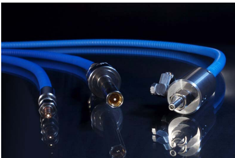
HPLK Baukastensystem, kombiniert mit anderen Steckverbindersystemen